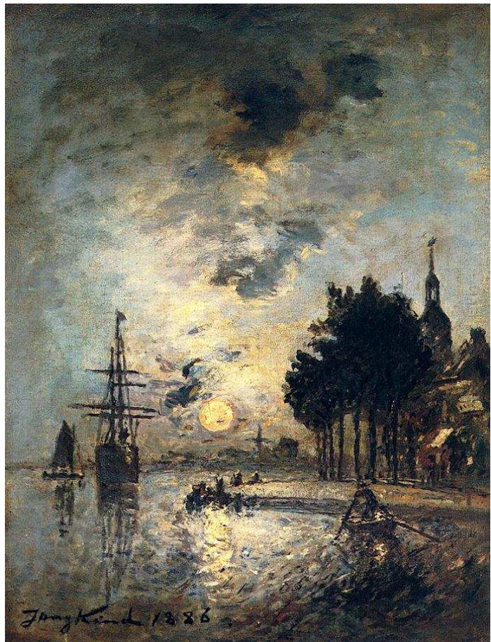
J.M.W. Turner 1823