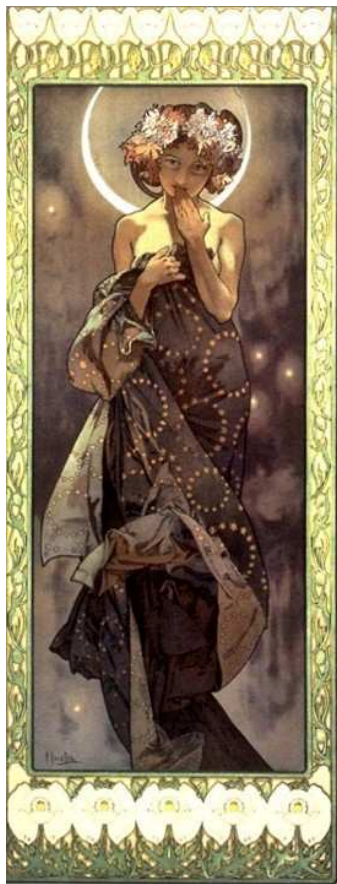
CLAIR DE LUNE